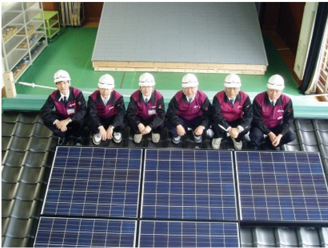
◆第一回研修受講者