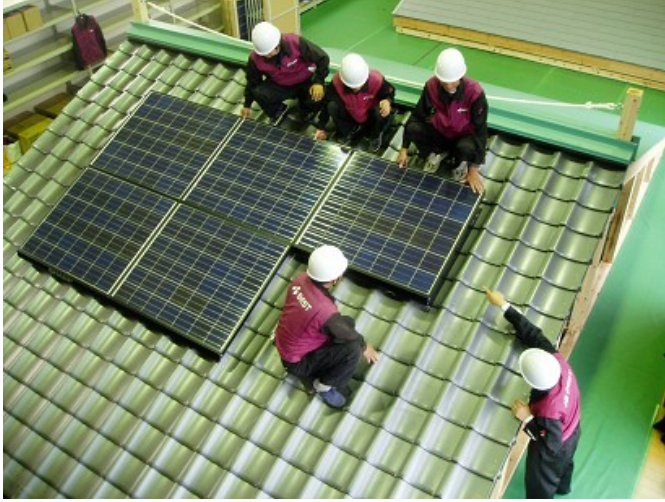
◆本番さながらの指導を受ける技術スタッフ！